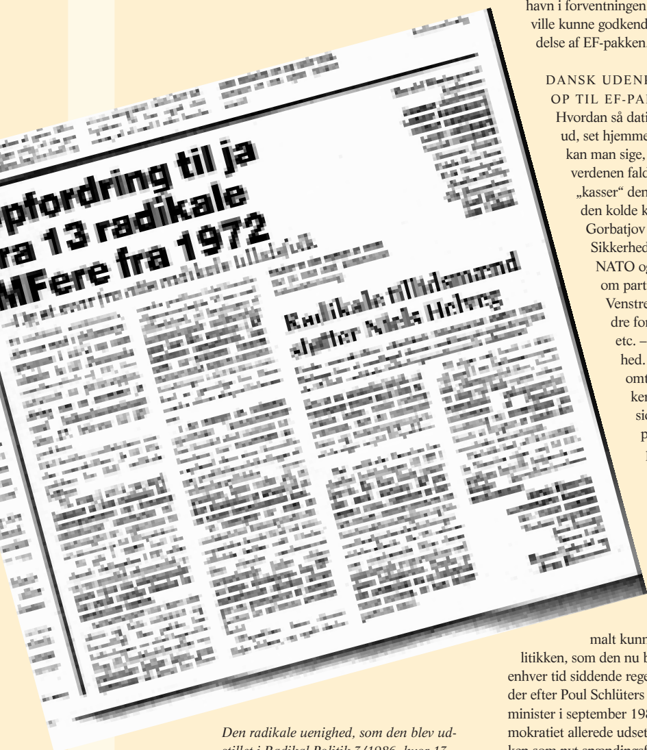
Den radikale uenighed, som den blev udstillet i Radikal Politik 3/1986, hvor 13 tidligere MFere opfordrede til at stemme ja.

Når beslutningen alligevel var problematisk, skyldtes det selvfølgelig at EPS-traktatfæstelsen var kædet sammen med beslutningen om det indre marked, og at traktatfæstelse af et eksisterende samarbejde